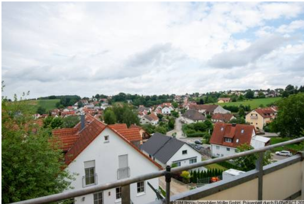
Ausblick vom Balkon