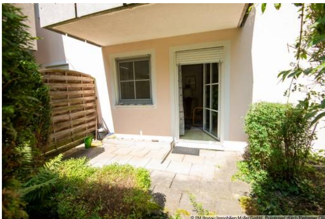
Terrasse Foto 2