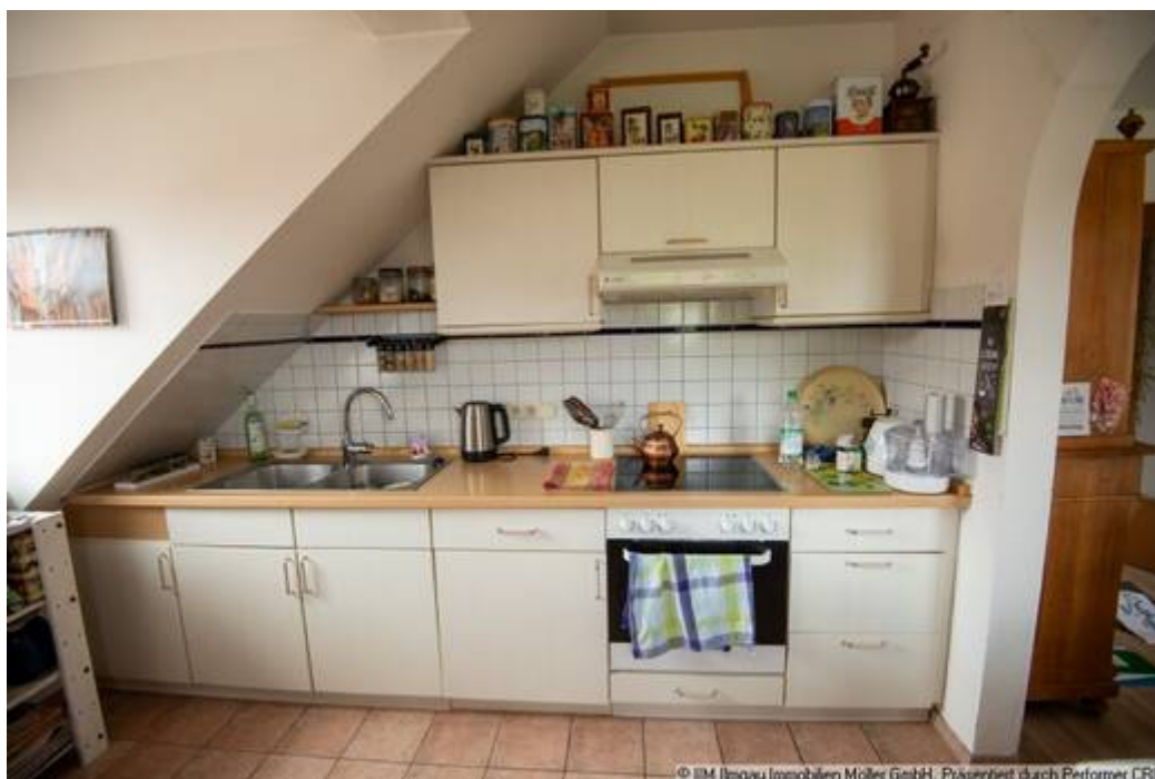
Küche mit Einbauküche