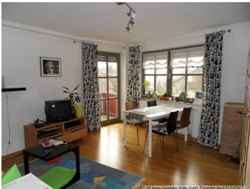
Teil des Wohnraumes